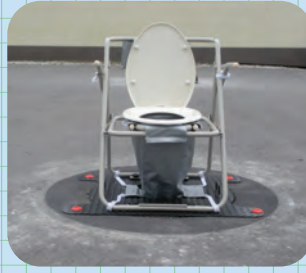
トイレを取り付けます