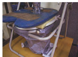
* トイレ座面強度検査 JIS S1203(1998) 2000N 異常なし

上記の試験結果は、条件や使用方法などにより同じ試験結果が得られないことがあります