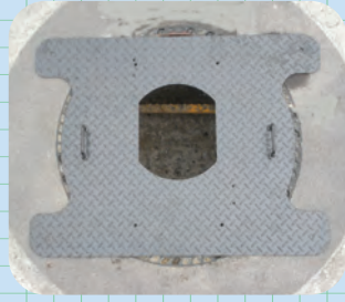
ベースをセットします