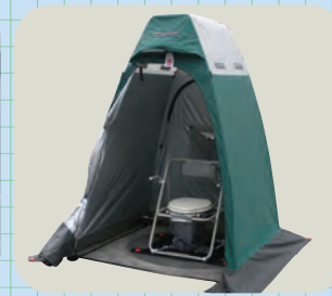
テントを覆います

災害はいつ起こるかわかりません。いざという時に本当に使える製品でないと困ります。実績があり、信頼できる、身体の不自由な方への配慮がされている「エベットさん」なら安心です。マンホール鉄ふた専門メーカーならではの高い安全性には自信があります。