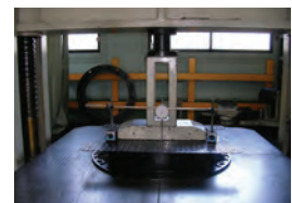
ベース部強度検査 基準 T-8 20KN 異常なし